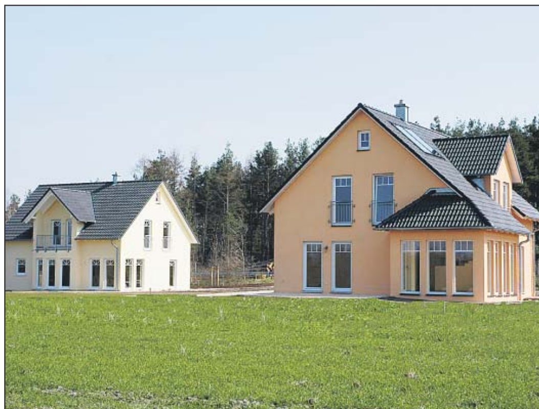
Die beiden neuen Musterhäuser von Brohm-Massivhaus in Steinberg am See.