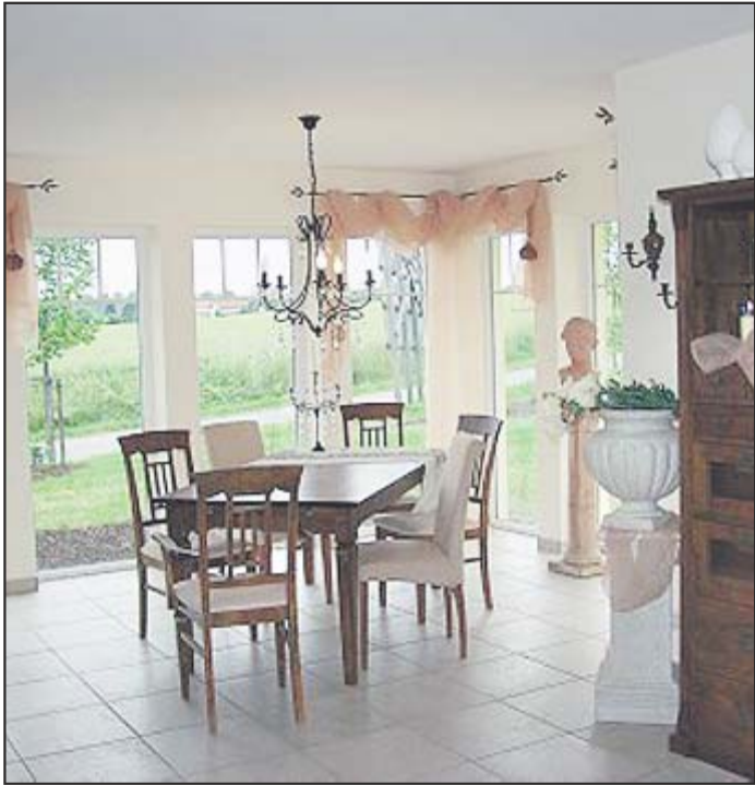
Wintergartenatmosphäre in einem Brohm-Massivhaus.

Viel Liebe zum Detail / Hoher Standard / Individuell planbar