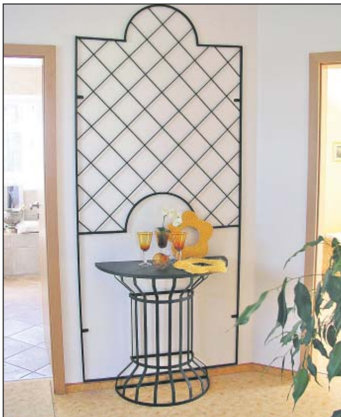
Liebe steckt im Detail – zu erfahren bei „Da Vinci“.

Ob in herkömmlichen Stil gebaut oder mit mediterranem „Touch“ gestaltet: Brohm-Massivhäuser sind den bei uns gültigen Bebauungsplänen angepasst und in jedem Baugebiet ein absoluter Blickfang.