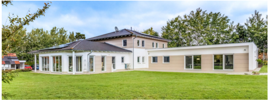
Brohm Massivhaus in Steinberg am See ist die Adresse für Bauwillige aus der Region.

Gebaut wird nur mit hochwertigen, massiven Materialien. Dem Unternehmen ist es gelungen, traditionelle Bauqualität mit modernen Gestaltungswünschen zu verbinden. Dafür sorgt ein engagiertes Team von bestens ausgebildeten Fachleuten, die vom ersten Gespräch bis zur Schlüsselübergabe Hand in Hand arbeiten und dabei die individuellen Kundenwünsche ermöglichen und erfüllen. Unter Berücksichtigung aller notwendigen Belange, wie etwa Grundstücksbeschaffenheit oder finanzieller Spielraum, formt Brohm Massivhaus jedes Bauvorhaben zu einem perfekten Ganzen. Und dass dies den Bauprofis gelingt, beweisen die vielen Einträge von zufriedenen und glücklichen neuen Hausbesitzern, die sich im Referenzbuch der Firma verewigt haben. Sicherheit in Planung und Ausführung